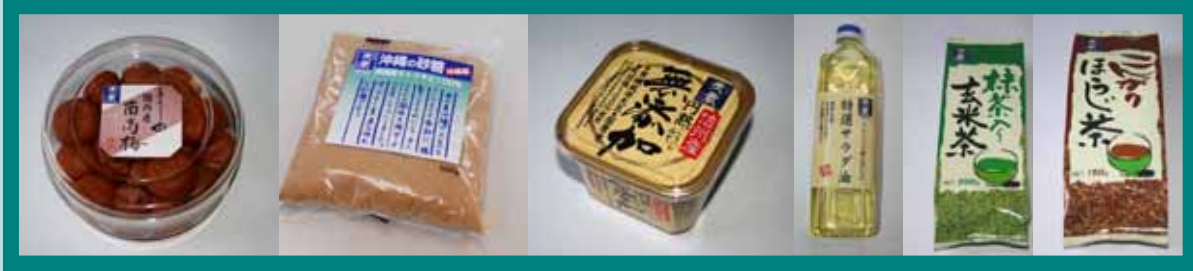
【梅干】 【砂糖】 【味噌】 【油】 【お茶】